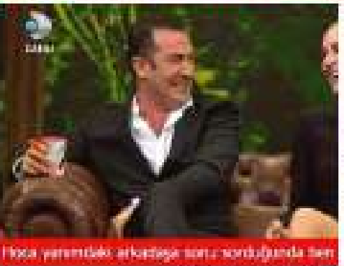
Hoca yarındaki arkasına sarkıyorduğında ben