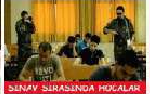
SENAV SIRASINDA HOCALAR